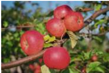
„Berlepsch“ ist eine der Apfelsorten die im Pomologischen Garten wächst. Es ist ein schmackhafter Tafelapfel mit einer guten Lagerfähigkeit

Immer öfter wird das Dorf Döllingen als Streuobst-gemeinde bezeichnet. Denn seit der Grundsteinlegung für den Pomologischen Schau- und Lehrgarten dreht sich hier fast alles ums Obst. Dessen Bekanntheitsgrad reicht inzwischen schon über die Brandenburger Landes-grenzen hinaus. Der Verein Kerngehäuse e.V. kümmert sich nicht nur um den Garten an sich, sondern organisiert seit vielen Jahren auch Veranstaltungen wie z.B. den Apfeltag und Seminare rund ums Obst. Für Schulklassen, Betriebsausflüge oder Busgruppen ist der Pomologische Garten ein beliebtes Ausflugsziel.