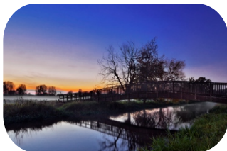
Wahrenbrück - Bernd Tanneberger