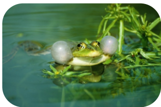
Teichfrosch - Friedheim Richter