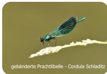
gebänderte Prachtlibelle - Cordula Schladitz

Wie erleben Sie die kleinen und größeren Gewässer im Naturpark? Vielleicht entdecken Sie auch an Ihrem Dorfteich so einiges Interessantes. Gehen Sie auf Fotopirsch und beteiligen sich an unserem nächsten Fotowettbewerb.